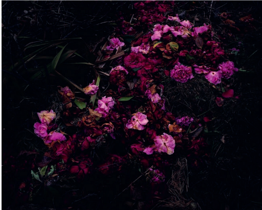
Marine LANIER, Les Roses, Le Capitaine de vaisseau , 2014 - en cours