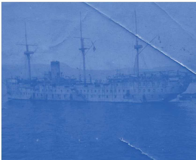
Marine LANIER, Vaisseau fantôme, Le Capitaine de vaisseau , 2014 - en cours