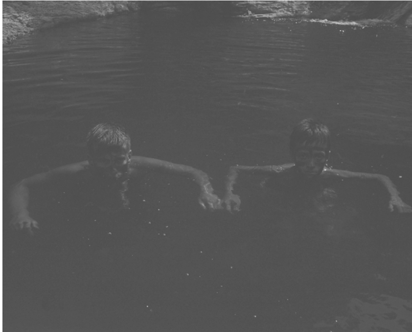
Marine LANIER, La Cérémonie, Le Soleil des loups , 2018