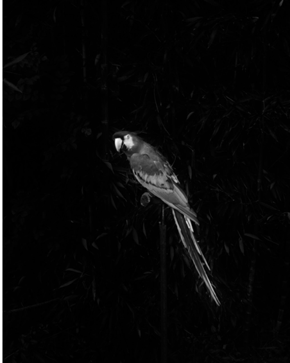
Marine LANIER, Perroquet, Le Capitaine de vaisseau , 2014 - en cours