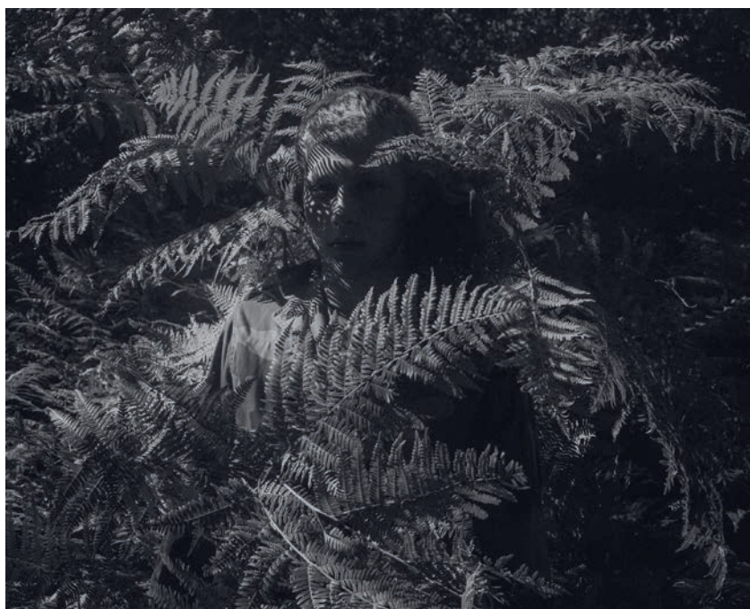
Marine LANIER, Totem, Le Soleil des loups , 2018 © Marine Lanier