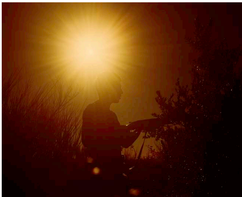
Marine LANIER, L'Eclipse, Le Soleil des loups , 2018